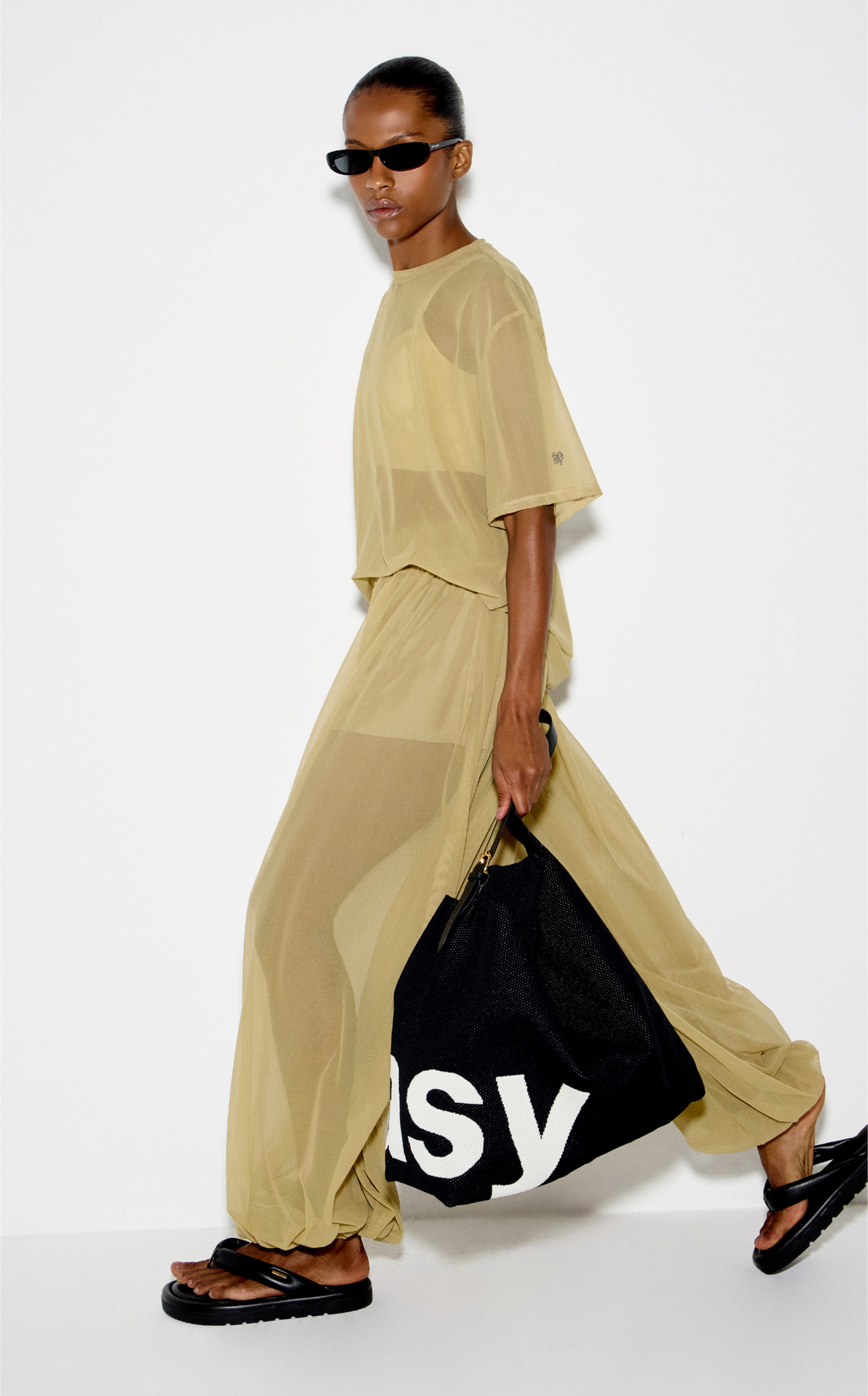
papete 537PP000021, bolsa 538SP000171