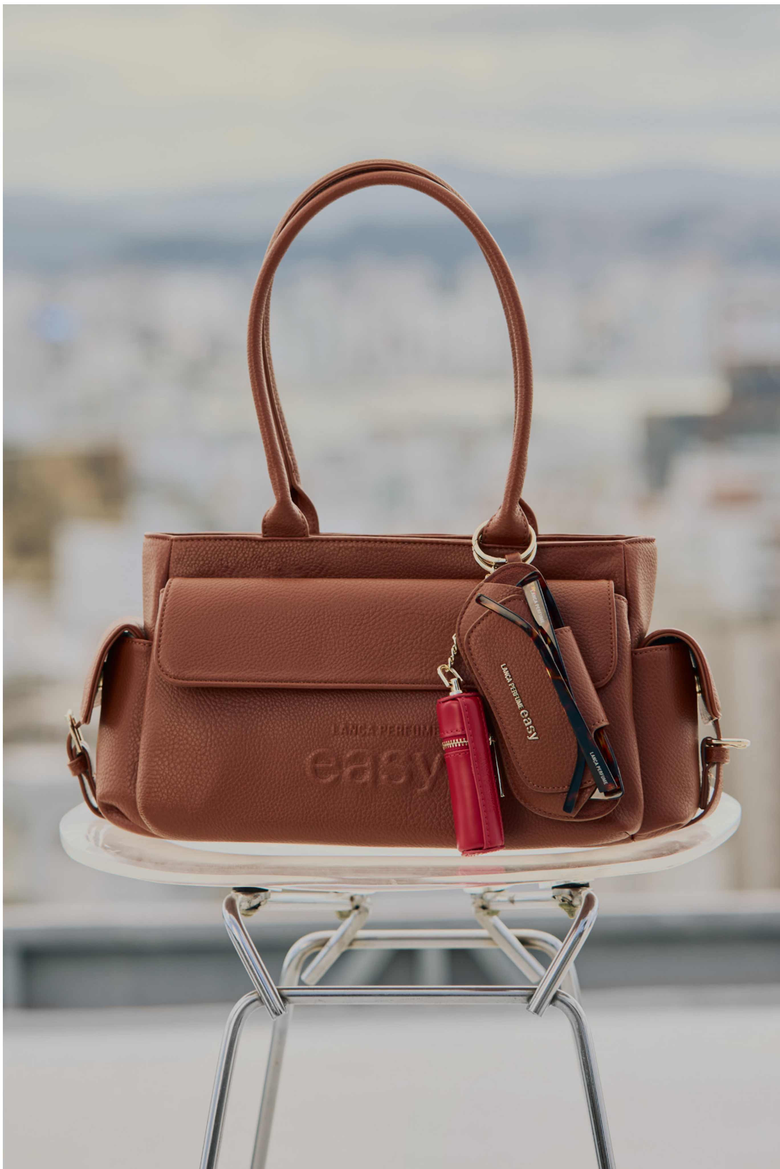
bolsa 538OB000837, porta óculos 530DV000039, chaveiro 530DV000031