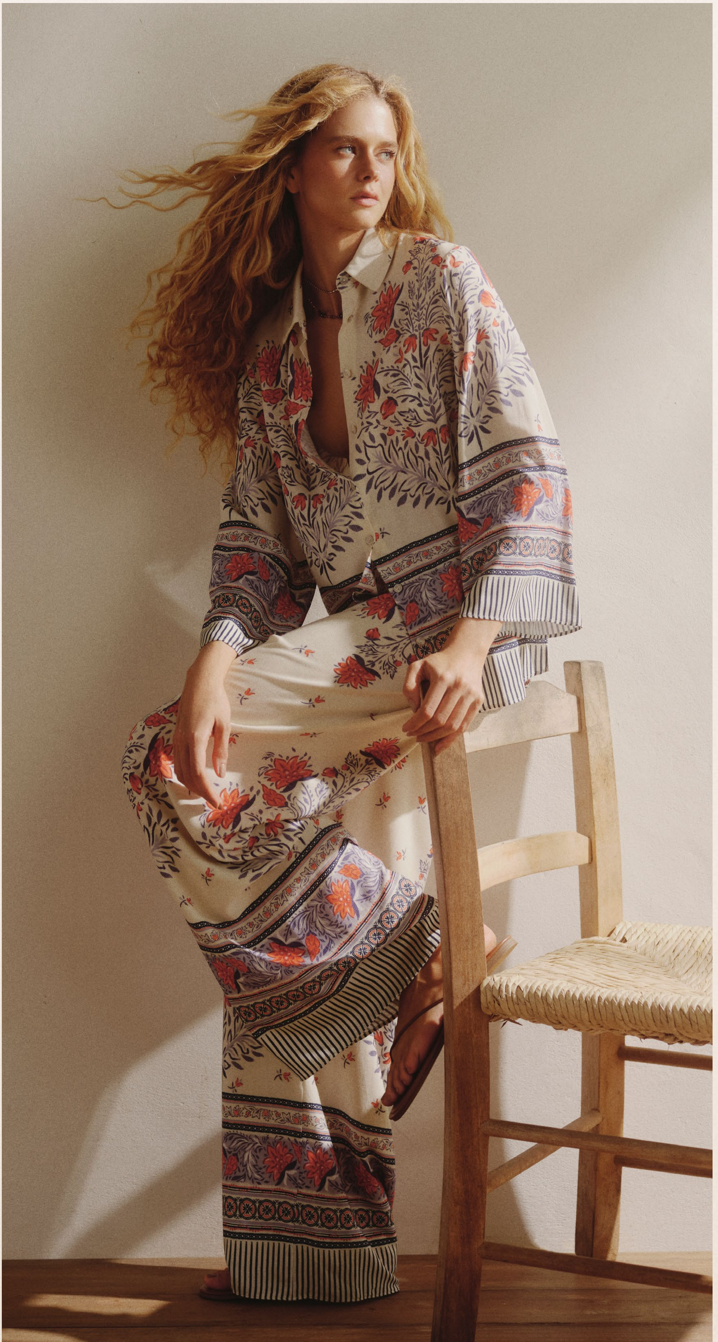
5692E BLUSA 5620E CALÇA