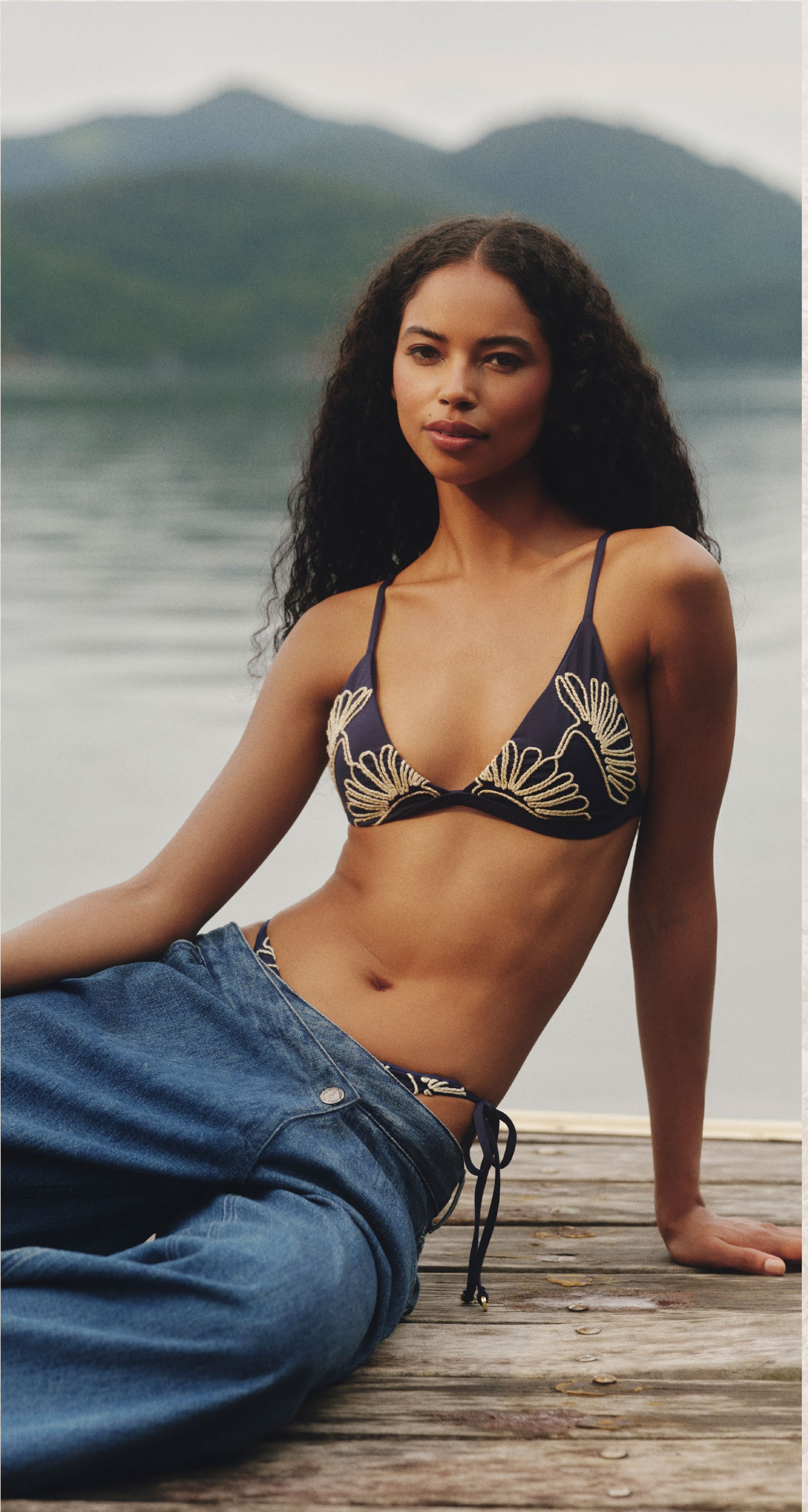
128LB TOP BIQUINI 128LB CALCINHA BIQUINI 0973E CALÇA