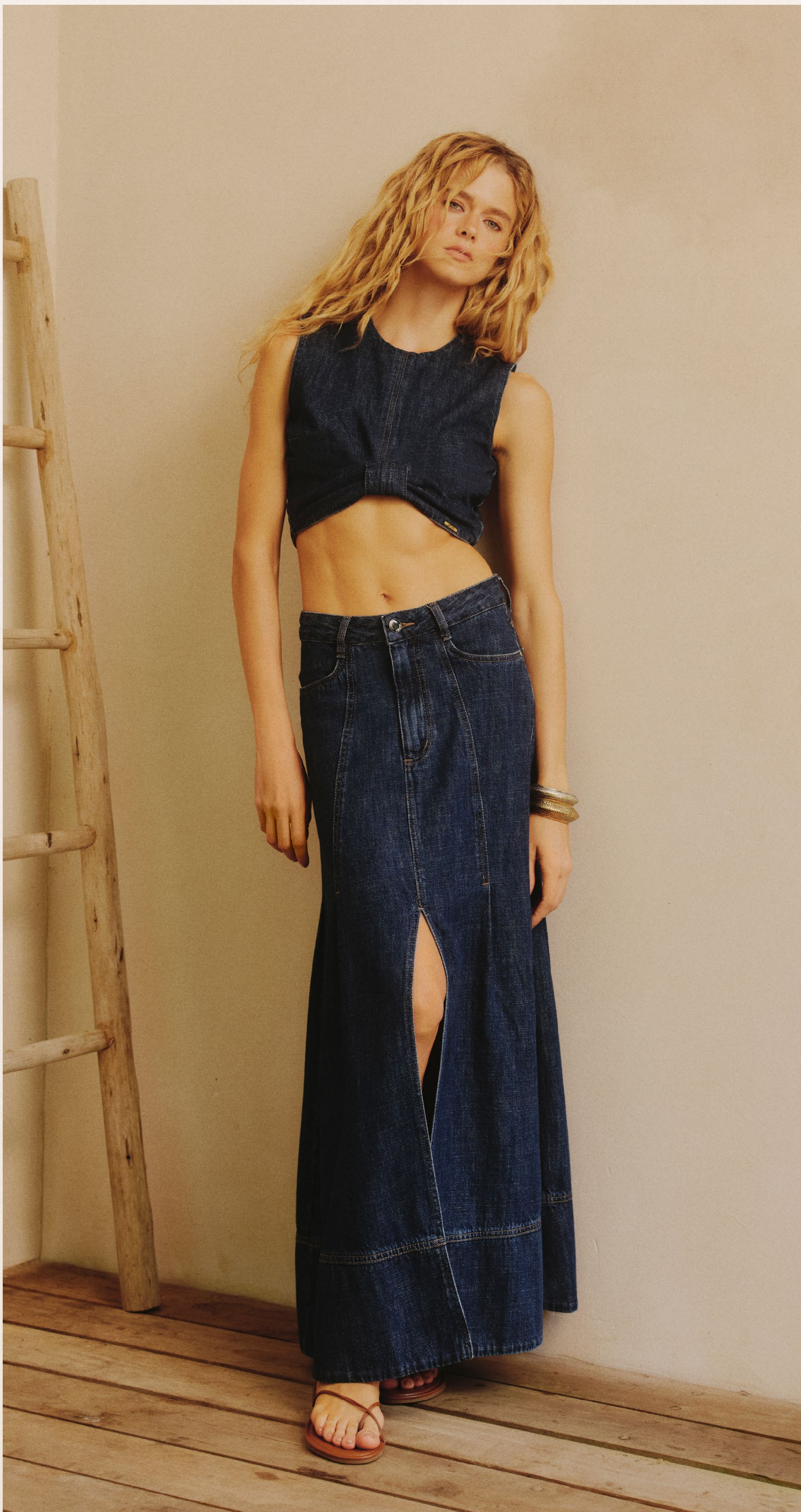
2492E TOP 2456E SAIA