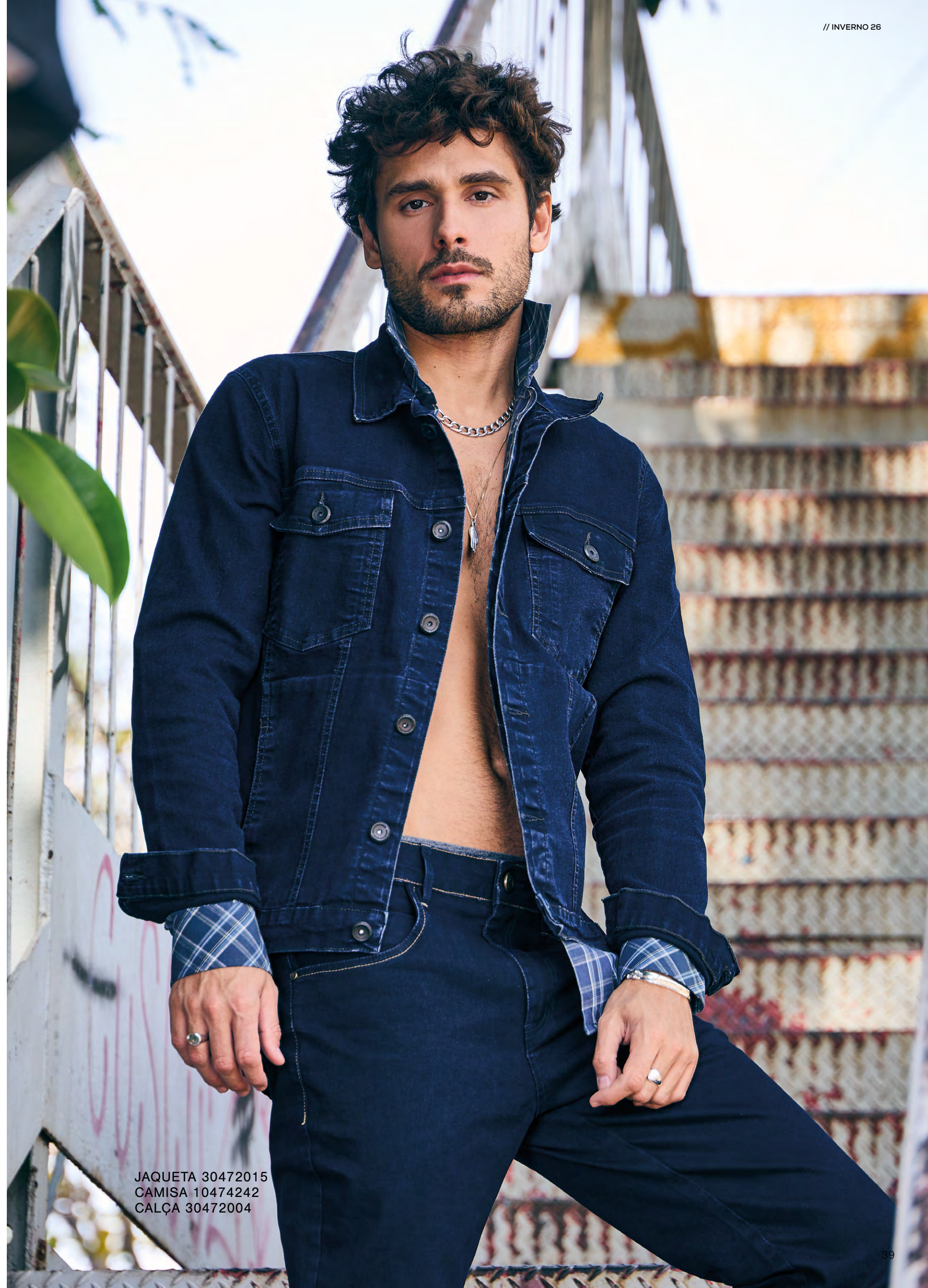
JAQUETA 30472015 CAMISA 10474242 CALÇA 30472004