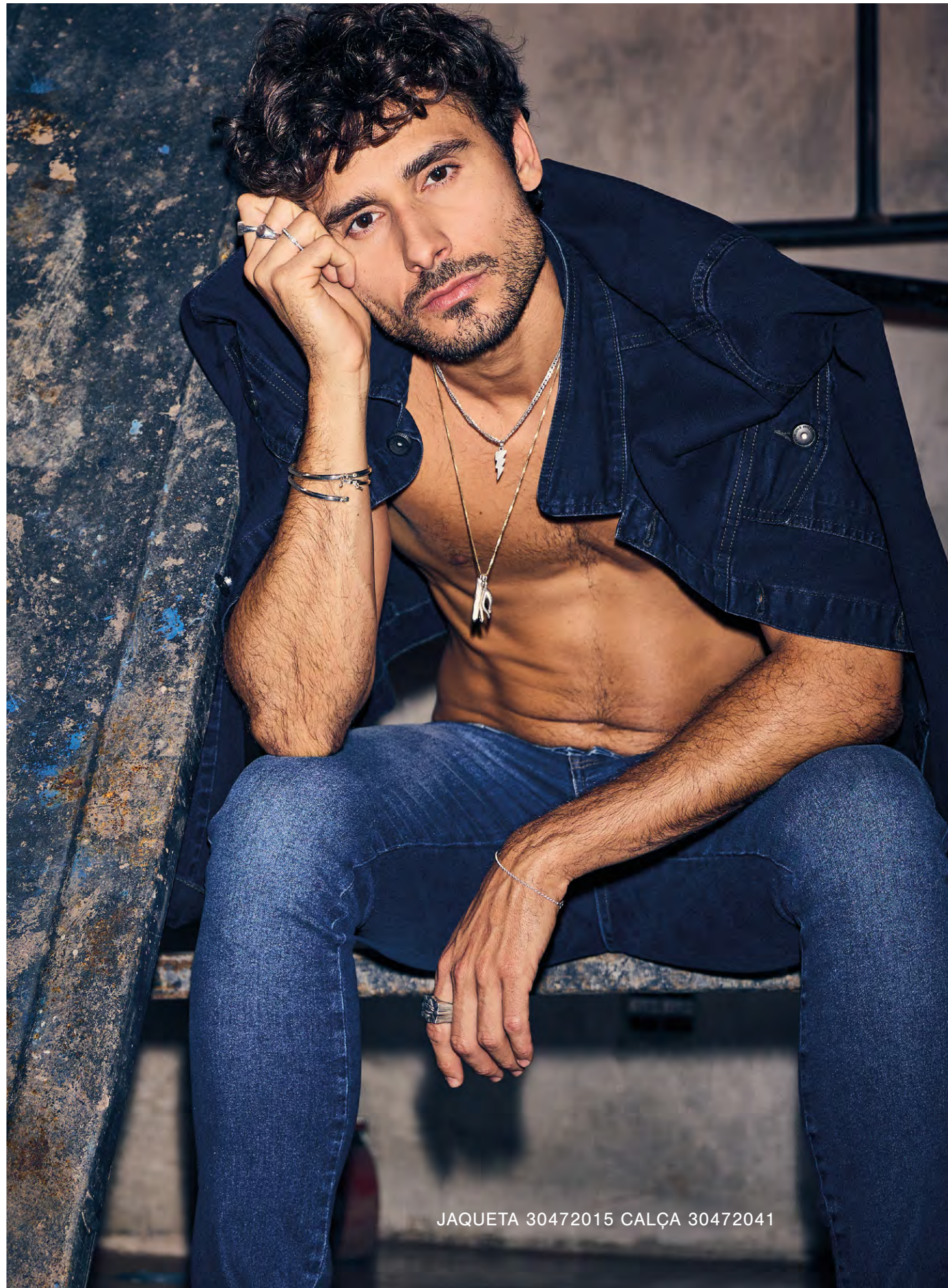
JAQUETA 30472015 CALÇA 30472041