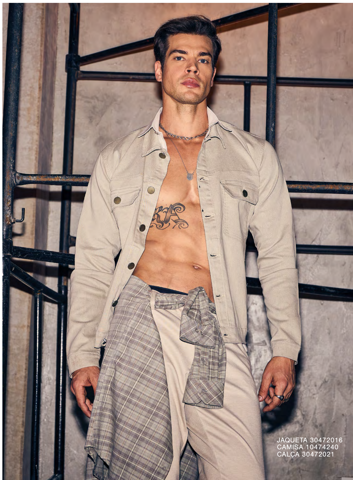
JAQUETA 30472016 CAMISA 10474240 CALÇA 30472021